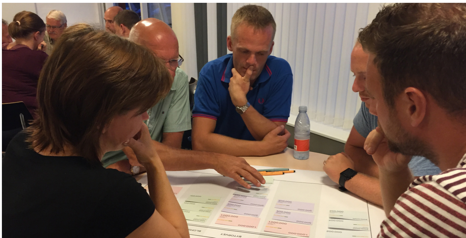
Foto fra følgegruppemøde 01 // Der arbejdes intenst på en prioritering af områdefornyelsens midler

Forberedelserne til det næste følgegruppemøde d. 25. oktober er i fuld gang og vi glæder os til at komme endnu nærmere en konkretisering af områdefornyelsens indsatser.